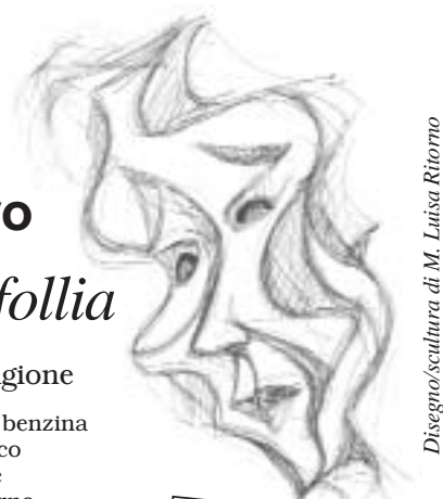
Disegno/scultura di M. Luisa Ritorno