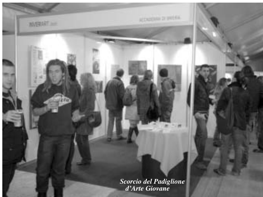
Scorcio del Padiglione d'Arte Giovane

È quindi a cuore aperto che accolgo l'invito dell'Assessorato alla Cultura di Inveruno di allestire all'interno di questa kermesse uno spazio con le opere di alcuni miei allievi del Dipartimento di Arti e Antropologia del Sacro dell'Accademia di Belle Arti di Brera. Mi trovo così a fare da padrino ad una manifestazione cui partecipano alcune decine di giovani talenti in formazione dalla quale sicuramente, come la cittadinanza tutta che interverrà, avrò molto da imparare. Devo sottolineare che la voglia di conoscere e sapere quanto accade intorno al pensare e al fare artistico è insita in me. Sì,