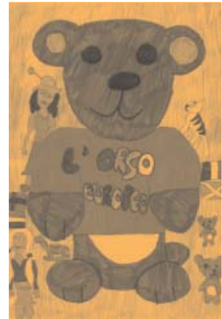
Un disegno di un'alunna della Scuola Elementare Garibaldi di Ravenna - classe V.

Tra i suoi libri: Inverno (Vallecchi, 1995), nuova edizione con carnevale (Lombardi, 1990); Ragioni di una forza in Simone Weil (Salvatore Sciascia, 1958); Paracelso (Scheiwiller, 1967); Sul mito d'Europa (L'Individuale, 1973); Serveto (L'Individuale, 1974); Infanzia (ed. Tre Lune, 2003 - con prefazione di Giuseppe Pontiggia).