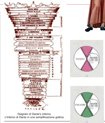
Diagram of Dante's Inferno. L'Inferno di Dante in una semplificazione grafica.

volontà di lettura e di un desiderio di partecipazione che nelle sue dimensioni sembra inesauribile, quasi a voler predisporre ancora a nuove "illustrazioni". L'intera mostra ed il volume che la accompagna sono la tangibile prova di quanto arte e letteratura continuano a convivere ed a produrre nuovi contributi; ritengo cioè collocare questo nuovo evento in quella grande storia dell'arte moderna e contemporanea che ha fatto del "libro d'artista" un oggetto straordinario di creatività ed a cui numerosi artisti anche presenti in questo progetto hanno portato significativi contributi; valga ricordare in questa occasione anche solo il nome di Ernesto Treccani nell'infinita e straordinaria sua produzione e proliferazione di opere-immagini; non posso non ricordare, contro l'oblio del tempo, la sua vivace e significativa collaborazione alle preziose Edizioni dell'Upupa create da quel grande scrittore fiorentino che fu Piero Santi negli anni '70. Daniele Oppi mi ha permesso con questa pagina di ricordare un patrimonio ed una cultura che non deve essere dimenticata; l'opera di Oppi torna cioè a sottolineare la persistenza positiva di ogni momento di compenetrazione estetica utile ad una fruizione che si qualifica attraverso i processi d'interferenza e di relazione.