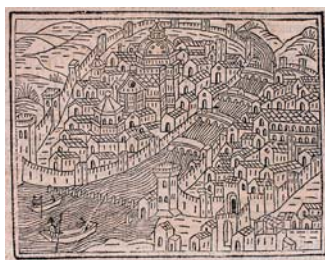
Firenze nel 1490. Biblioteca Comunale Forteguerriana di Prato.